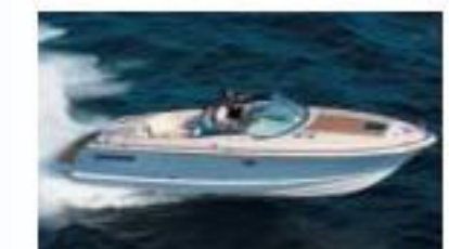
Chris-Craft Corsair 33 - Новый! (от 476600 $)