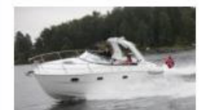
Bavaria Sport 28 - Новый! (61 000 евро)