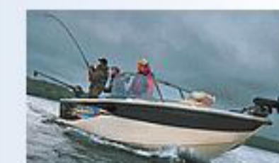
Моторные лодки Crestliner