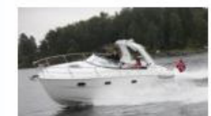
Bavaria Sport 28 - Новый! (61 000 евро)