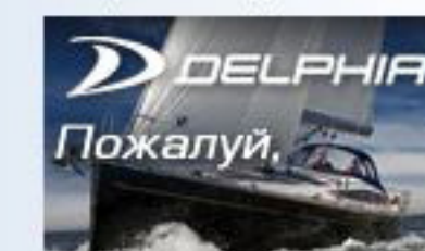
Парусные яхты Delphia