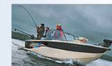
Моторные лодки Crestliner