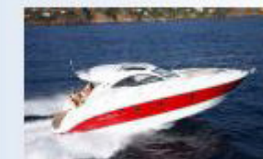
Monte Carlo 37 HT - Новый! (199 900 Евро)