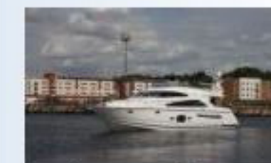
Fairline Squadron 55 - Новый! (от 868 200 Фунт)