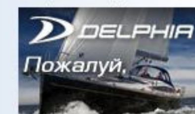
Парусные яхты Delphia