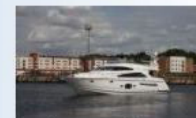
Fairline Squadron 55 - Новый! (от 868 200 Фунт)